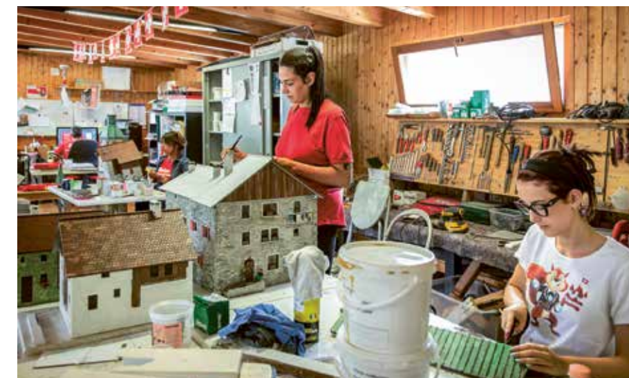
Dans l'atelier, des décoratrices 3D réparent les modèles cassés.

Alessandro Rezzonico partage cet avis: «Nous discutons en toute franchise.» Il présente ainsi avec transparence la manière dont sont menées les réparations. «Je me sens parfaitement soutenu par la Mobilière.»