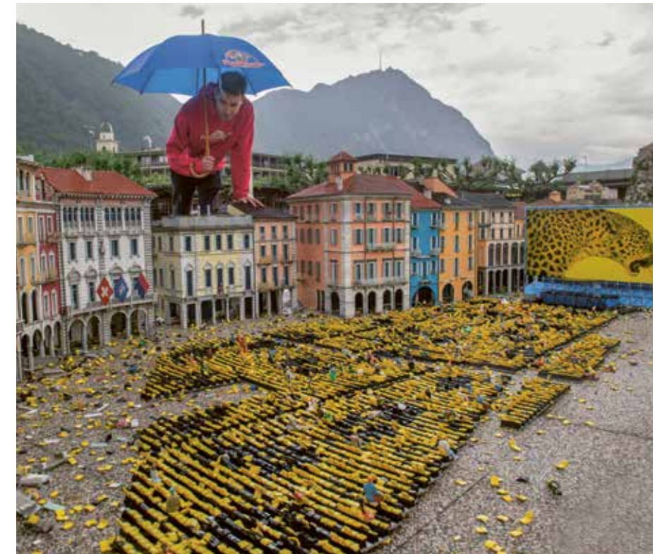
Sur la reconstitution de la Piazza Grande de Locarno, un grand nombre de chaises sur les plus de 5000 pièces collées une par une ont été endommagées.

Heureusement, la tempête n'a pas tout abîmé. Plus solides, les nouveaux matériaux utilisés, tels que le PVC, ont bien résisté à la grêle. C'est le cas du bâtiment de l'ONU à Genève: «Ici, seuls quelques ornements ont été cassés. Les 193 drapeaux en aluminium sont restés intacts», déclare le vice-directeur.