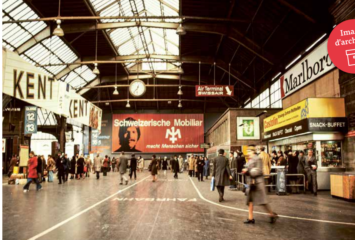
Gare centrale de Zurich, il y a près de 50 ans: les publicités de la Mobilière ont pignon sur rue.