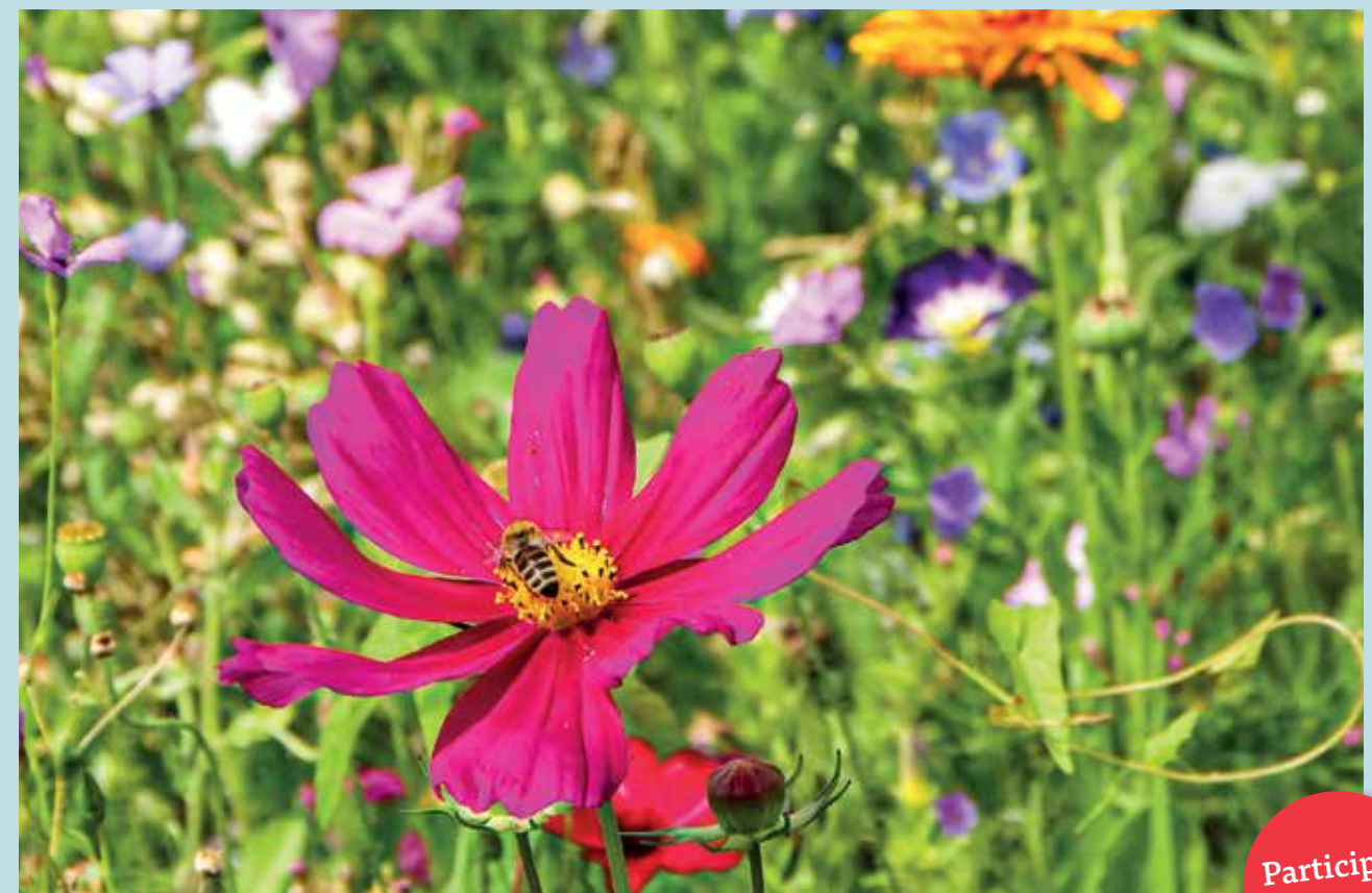
Les prairies fleuries sont idéales pour la biodiversité.

sa femme et, après une période de deuil, redécouvre l'amour de la moto qu'il partageait avec elle. Céline se lance dans une carrière de clown après avoir perdu son emploi. La Mobilière est aux côtés de ses clients même dans les moments difficiles. Elle leur ouvre de nouvelles perspectives avec des solutions d'assurance, de prévoyance et bien plus encore. mobiliere.ch/film-d-entreprise