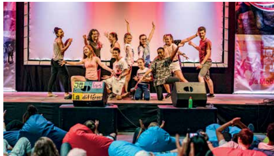
À l'Atelier du Futur, les jeunes découvrent comment des idées créatives peuvent avoir de grands effets.