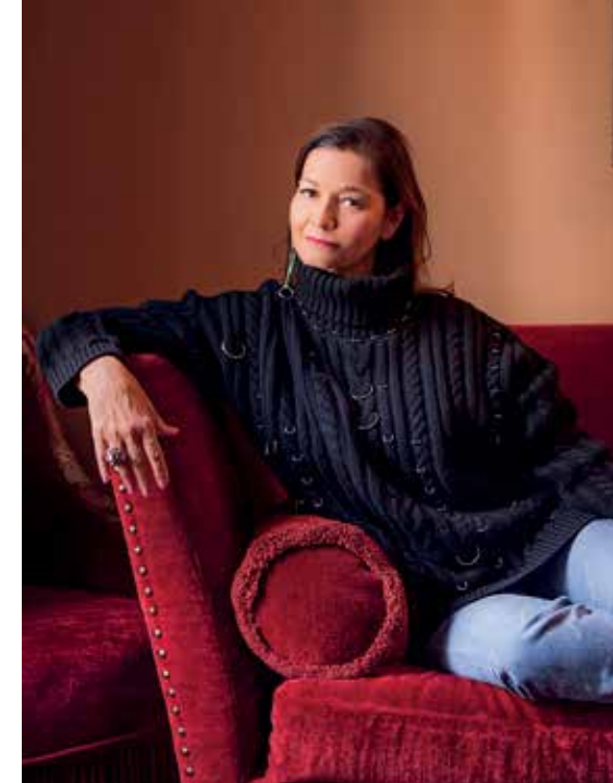
Sylvie Fleury – «Palette of Shadows», Paris, 2018