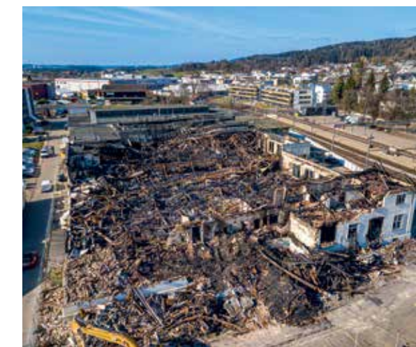
L'incendie a détruit presque toute l'usine.

Autres images et vidéos de l'incendie: mobiliere.ch/buehrer