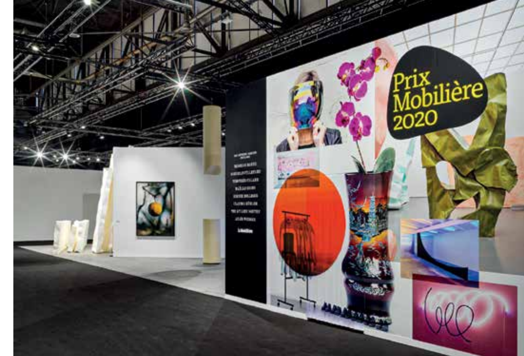
Tous les nominés du «Prix Mobilière» sont présentés à artgenève dans le pavillon de la Mobilière.