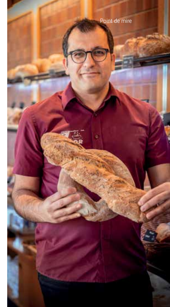
La boulangerie de Duran Mor a subi deux cyberattaques en l'espace de deux semaines.

L'assurance cyberprotection de la Mobilière prend en charge les frais d'intervention d'experts informatiques en cas de perte, d'endommagement et de vol de données, et mandate un spécialiste dans les cas de cyberchantage. La perte de produits générée par la paralysie des systèmes est prise en charge pour la période d'interruption. En cas de fraude dans des systèmes de paiement en ligne, la perte d'argent est indemnisée. L'assurance cyberprotection fournit également une aide en cas d'atteinte à la personnalité ainsi qu'une assistance informatique. mobiliere.ch/cyber-entreprises